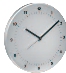
SMALL TIME Ø 31 cm Linea di orologi da parete con movimento al quarzo continuo realizzati in alluminio verniciato. Quartz wall clocks line made in varnished aluminium.