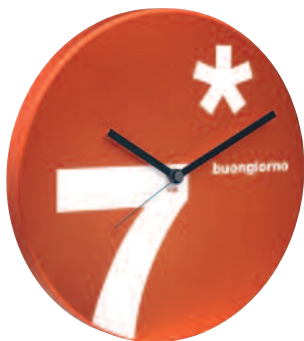
TIME31BG - Time buongiorno small Ø cm 31