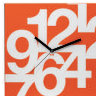
TIMENS - Time square numeri soft cm 35 x 35 x 3 TIMENSP - Time square numeri soft plus cm 35 x 35 x 3 TIME27NS - Time square cube numeri soft cm 27 x 27 x 5