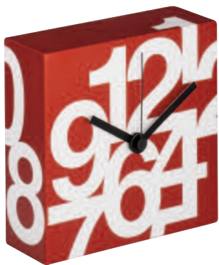
TIME3NS - Time square mini numeri soft cm 16 x 16 x 6

Linea di orologi da tavolo con movimento al quarzo continuo realizzati in mdf laccato con stampa serigrafica sulle sei facce. Table clocks line with quartz movement made of laquered mdf with silkscreen printing on all the six faces.