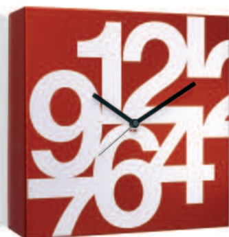
TIME SQUARE cm 35 x 35 x 2,5 Linea di orologi da parete con movimento al quarzo continuo. Quartz wall clocks line.