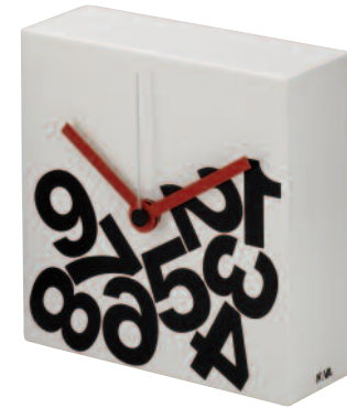
TIME3J - Time square mini jetlag cm 16 x 16 x 6