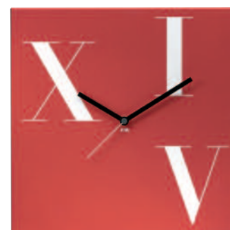
TIMERS - Time square roman cm 35 x 35 x 3 TIMERSP - Time square roman plus cm 35 x 35 x 3