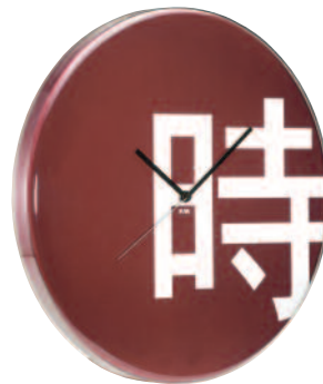
TIME2K - Time kanji Ø cm 45