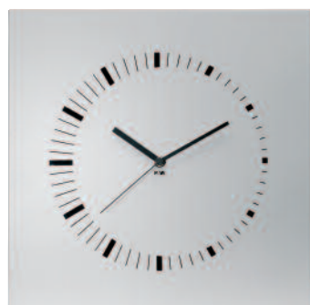
TIME - Time square indici cm 35 x 35 x 3 TIMEP - Time square indici plus cm 35 x 35 x 3