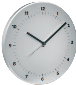
TIME2C - Time classic Ø cm 45 TIME31C - Time classic small Ø cm 31