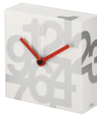
TIME3NS - Time square mini numeri soft cm 16 x 16 x 6