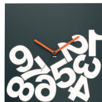
TIMEJ - Time square jetlag cm 35 x 35 x 3 TIME27J - Time square cube jetlag cm 27 x 27 x 5