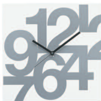
TIMENS - Time square numeri soft cm 35 x 35 x 3 TIMENSP - Time square numeri soft plus cm 35 x 35 x 3