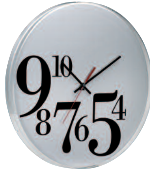
BTIME2B - Big time bodoni Ø cm 70 TIME2B - Time bodoni Ø cm 45