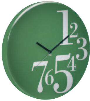
TIME2B - Time bodoni Ø cm 45 TIME31B - Time bodoni small Ø cm 31