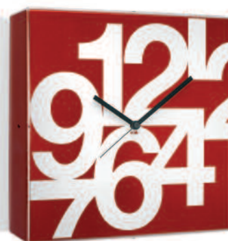
TIME SQUARE PLUS cm 35 x 35 x 2,5 Linea di orologi da parete con movimento al quarzo continuo. Quartz wall clocks line.