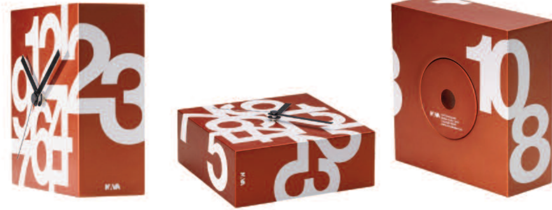
TIME SQUARE MINI Numeri Soft cm 16 x 16 x 6

Linea di orologi da tavolo con movimento al quarzo continuo realizzati in mdf laccato con stampa serigrafica sulle sei facce. Table clocks line with quartz movement made of laquered mdf with silkscreen printing on all the six faces.