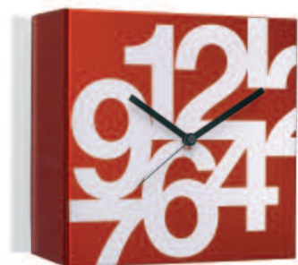
TIME SQUARE CUBE cm 27 x 27 x 5 Linea di orologi da parete con movimento al quarzo continuo. Quartz wall clocks line.