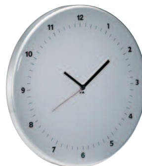
TIME CLASSIC Ø 45 cm Linea di orologi da parete con movimento al quarzo continuo realizzati in alluminio verniciato con copertura in plexiglass. Quartz wall clocks line made in varnished aluminium with plexiglass cover-up.