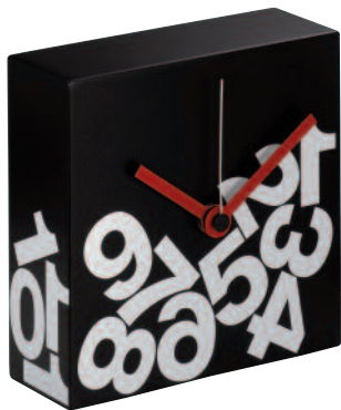
TIME3J - Time square mini jetlag cm 16 x 16 x 6