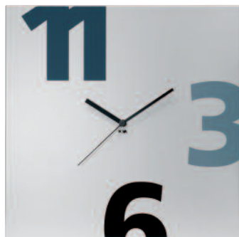
TIMENG - Time square numeri grandi cm 35 x 35 x 3 TIMENGP - Time square numeri grandi plus cm 35 x 35 x 3 TIME27NG - Time square cube numeri grandi cm 27 x 27 x 5